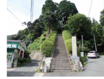
日本タンクステーション

大興善寺参道 急な階段（120 数段）を上ります。 体力に自信のない方は右側 道路にお進み下さい。