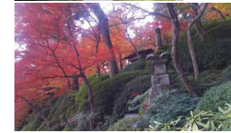
紅葉のときの風景