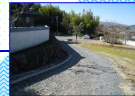
舗装されていない道です