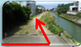
狭い未舗装道路(川沿い)