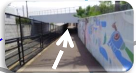
鹿児島本線ガードくぐる。