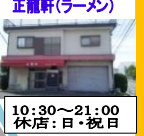
正龍軒(ラーメン) 10:30~21:00 休店:日・祝日