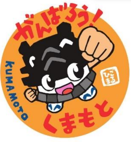
熊本市イメージキャラクター「ひごまる」