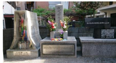
第2次世界大戦終戦まぎわ爆弾が学校を直撃し127名の命が失われました。今でも小中学校の生徒が慰霊碑を清掃し、戦争の悲惨さを風化させないような取り組みをしています。