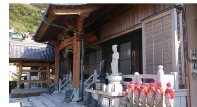
空襲で亡くなった子供達の小さな遺骨を納めたお地藏さまがあります。境内からの眺めは絶景です。