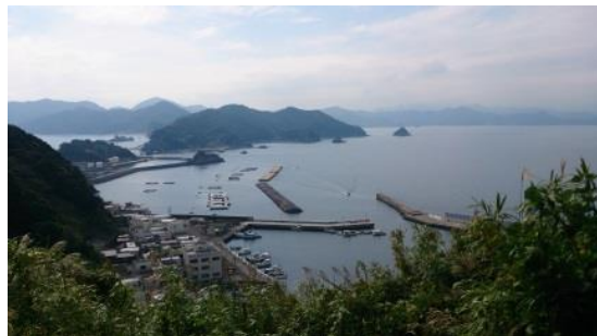
豊後水道や保戸の集落が見渡せる絶景スポット