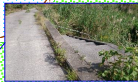
細い階段を下りていく