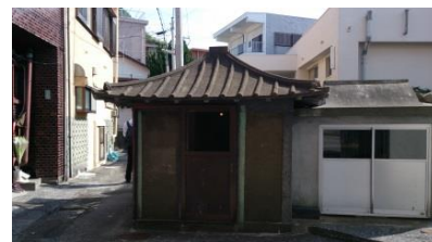
虎御前伝説は各地にあります、この保戸島では厄病除けの祭神とされています。