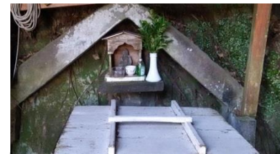
真言宗草庵の横にあるこの井戸は、石清水による良質の水で、水道が普及するまで村唯一の飲料水でした。

やま丸時刻表 1日6便 所要時間 約25分 料金 (大人 片道 880円・子供 片道 440円)